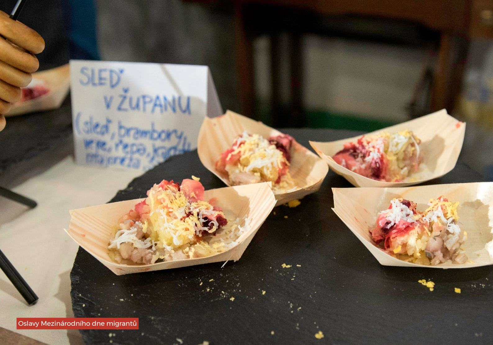
Oslavy Mezinárodního dne migrantů