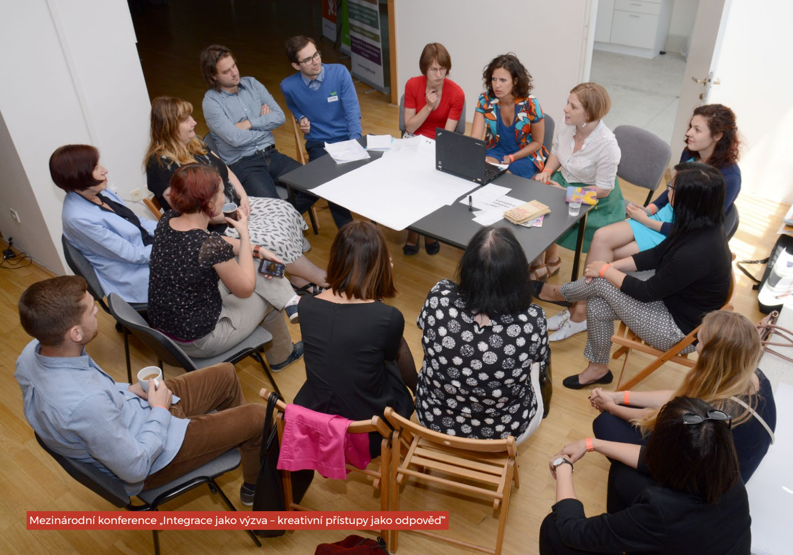
Mezinárodní konference „Integrace jako výzva - kreativní přístupy jako odpověď“